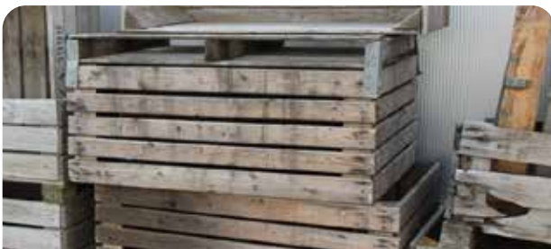
Obstkisten oder Paletten