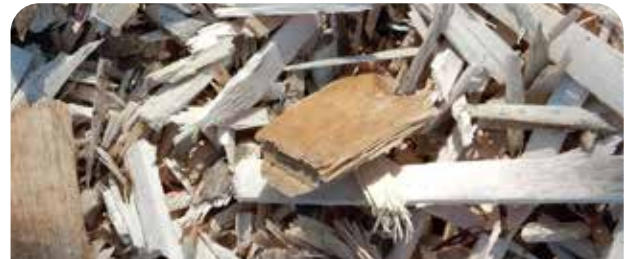
Althölzer oder Restfraktionen aus der Holzverarbeitung